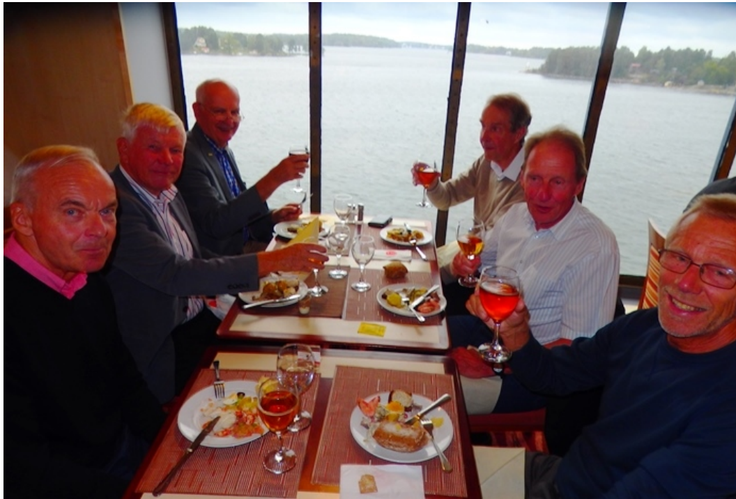
Vid det här bordet är man försiktig med starksprit. Man nöjer sig med öl och vin.