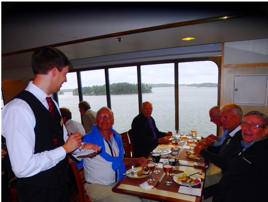
Vid det här bordet är uppfattningen att ett svenskt smörgåsbord kräver en snaps. Det blir också resultatet.